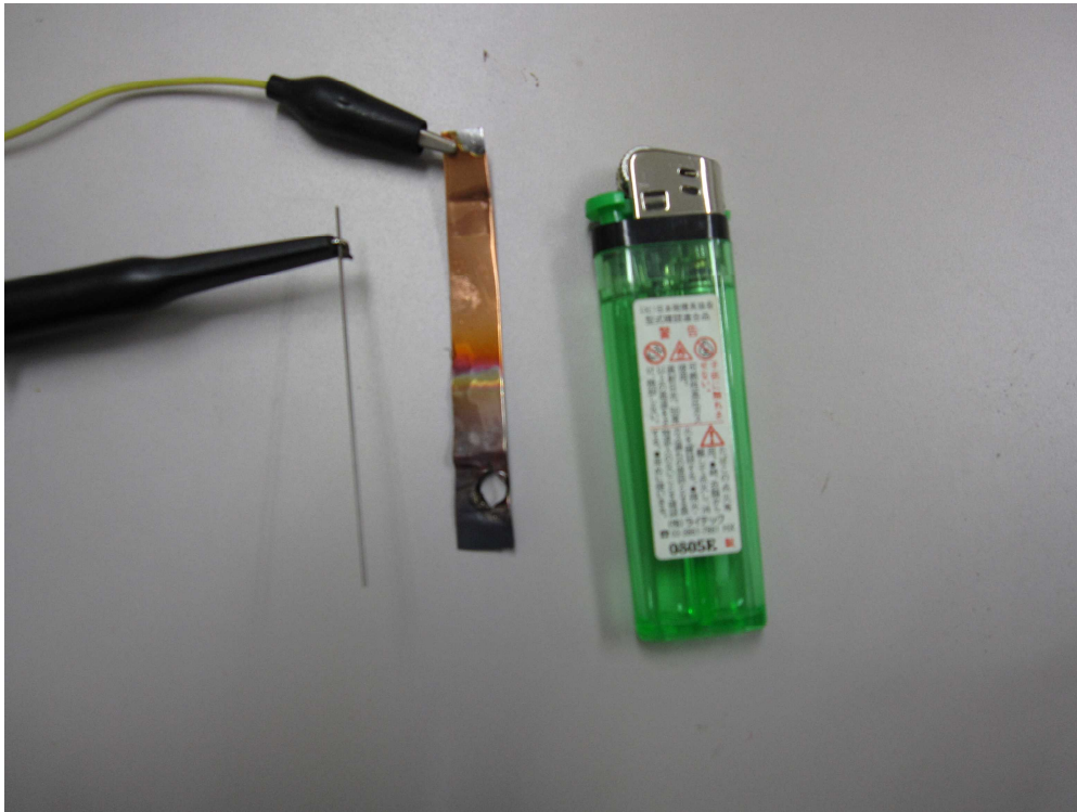
ガスライターと2つの電極